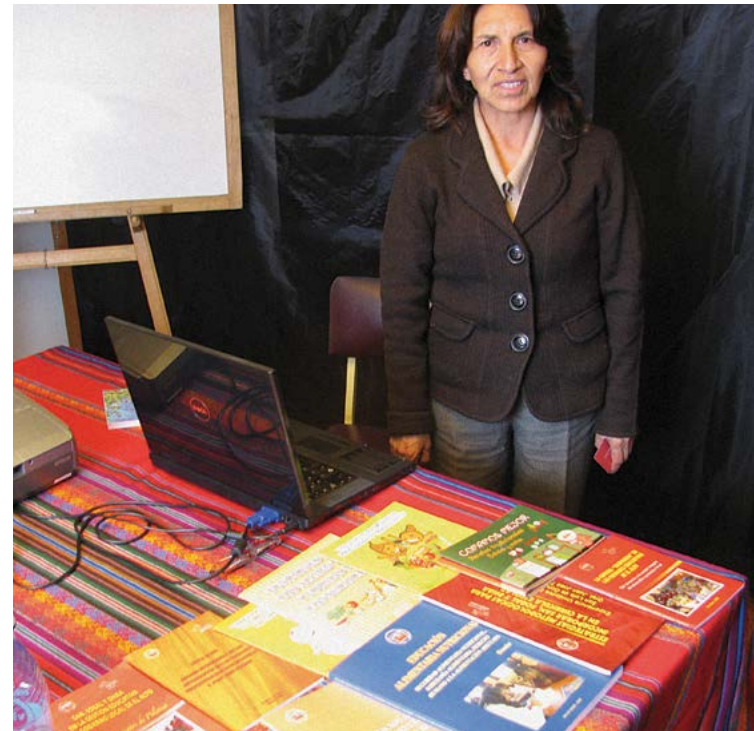
Egresada DEC con nuevas políticas y materiales para programas de Seguridad Alimentaria

100% de los graduados recomiendan el programa a otras personas