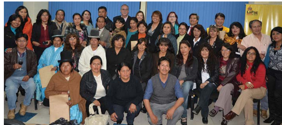
Egresados DEC de La Paz, Bolivia

Cuando la gente termina este programa no sólo tienen un nuevo enfoque para ver las posibilidades sociales y económicas, sino que además saben cómo hacer cosas concretas como: planificación estratégica, visualización de la comunidad, mapeo institucional, planificación empresarial, recaudación de fondos, análisis financiero, diálogo público y resolución de conflictos. Los graduados DEC terminan el programa y son capaces de crear, planificar y desarrollar nuevas políticas, programas, empresas o servicios. Este aumento de la capacidad es lo que impulsa el desarrollo económico. Las herramientas y los métodos que enseñamos en el programa son útiles, pertinentes y significativos.