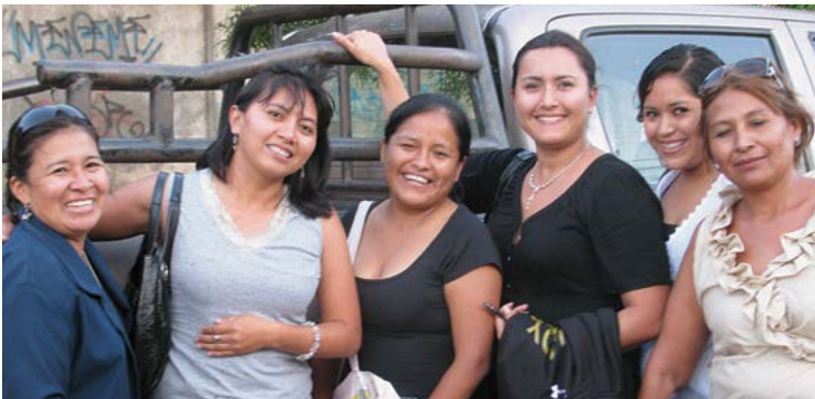
Participantes DEC de Santa Cruz, Bolivia

Los participantes son profesionales, funcionarios públicos, expertos técnicos, educadores, y líderes municipales, comunitarios y empresariales.