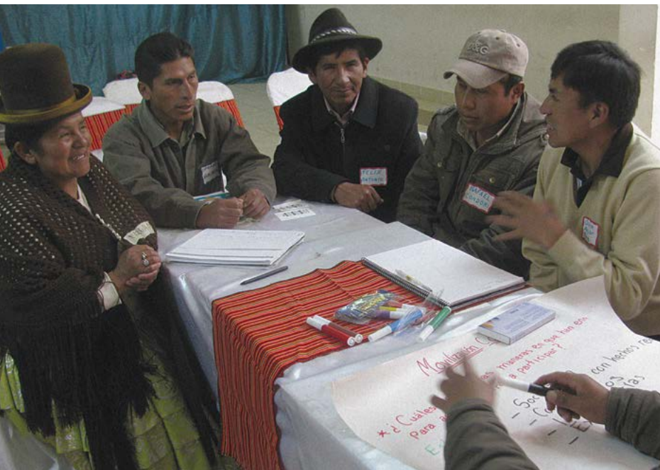
Participantes DEC de Viacha, Bolivia